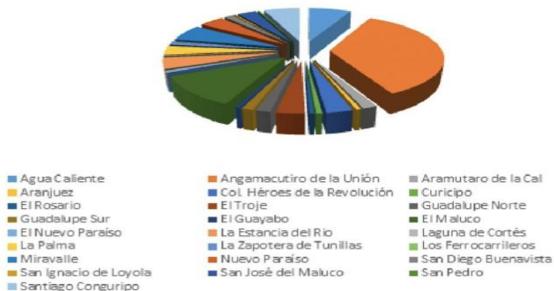
Distribución de Población por comunidades